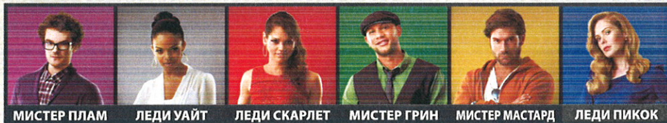
МИСТЕР ПЛАМ ЛЕДИ УАЙТ ЛЕДИ СКАРЛЕТ МИСТЕР ГРИН МИСТЕР МАСТАРД ЛЕДИ ПИКОК

Один из шести подозреваемых – убийца. Ты должен узнать, кто.