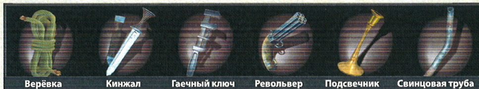
Верёвка Кинжал Гаечный ключ Револьвер Подсвечник Свинцовая труба

Одним из этих орудий было совершенно убийство. Ты должен узнать, каким.