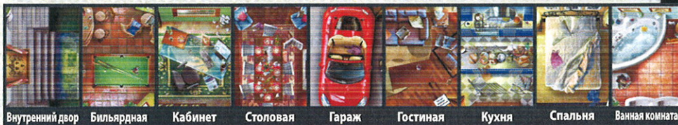
Внутренний двор Бильярдная Кабинет Столовая Гараж Гостиная Кухня Спальня Ванная комната

Одно из них – место преступления. Ты должен узнать, какое.